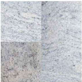
KAMIEŃ 1 JUPARANA COLOMBO