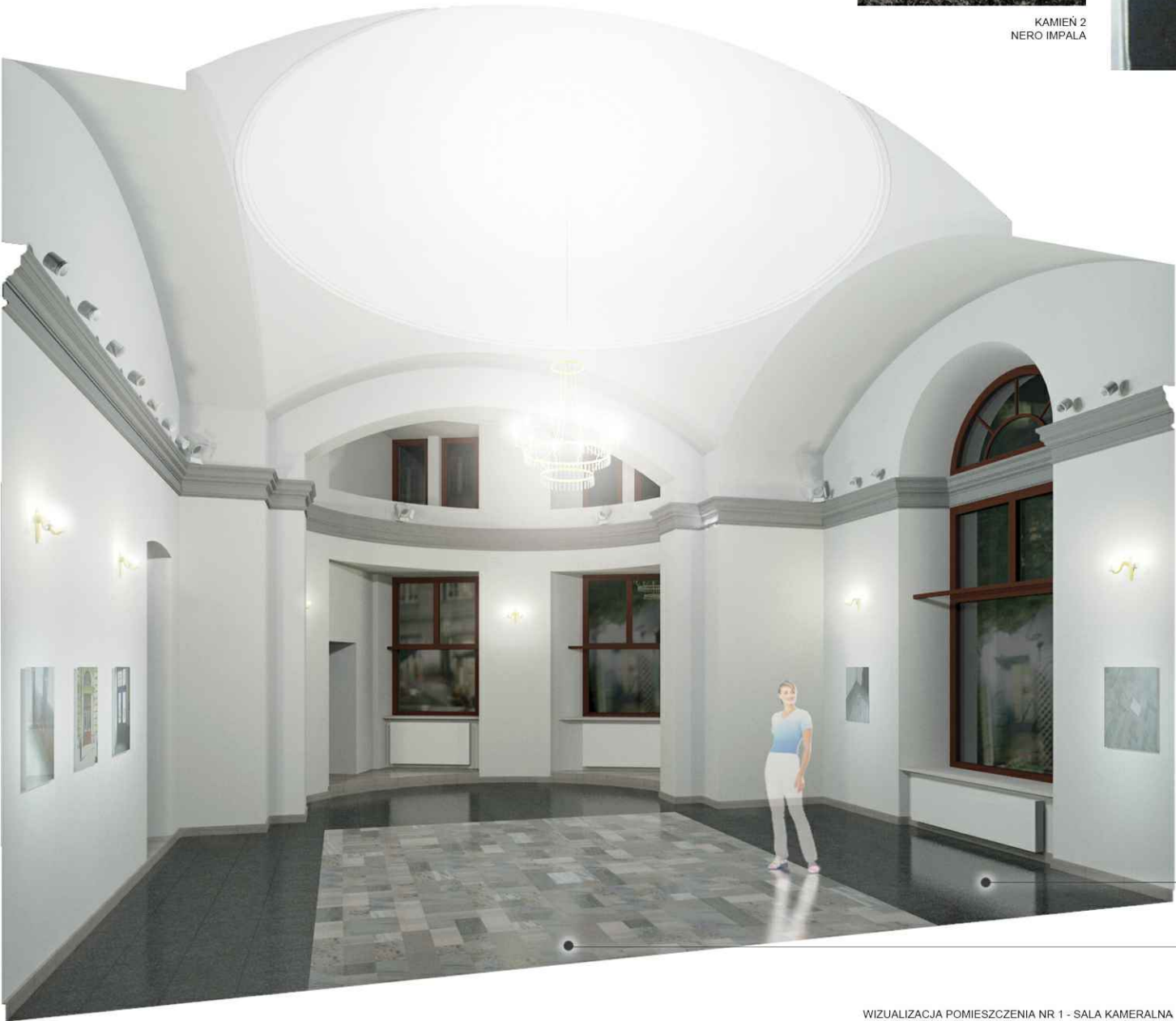
WIZUALIZACJA POMIESZCZENIA NR 1 - SALA KAMERALNA