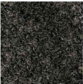
KAMIEŃ 2 NERO IMPALA